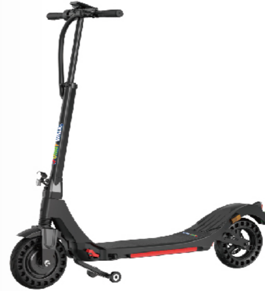
D1 Elektrikli Scooter